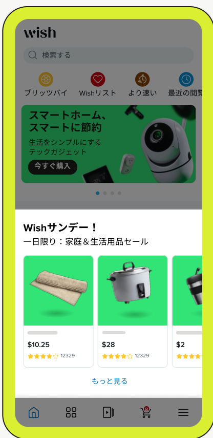
メインホームページ